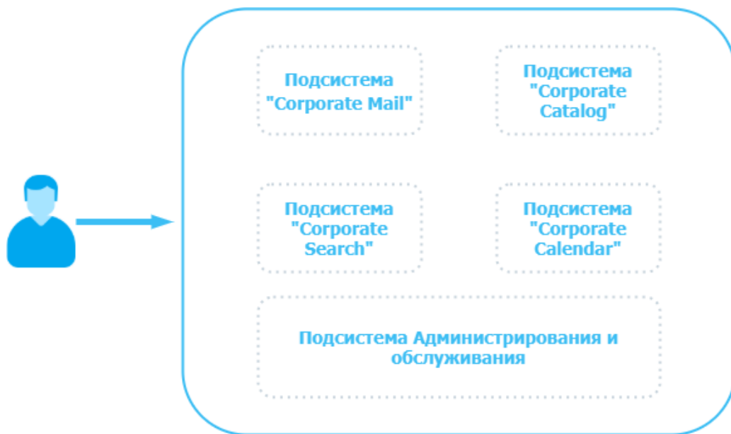
Рисунок 1 – Общая логическая схема «Mailion»

Общая логическая схема «Mailion» приведена на Рисунке 1.