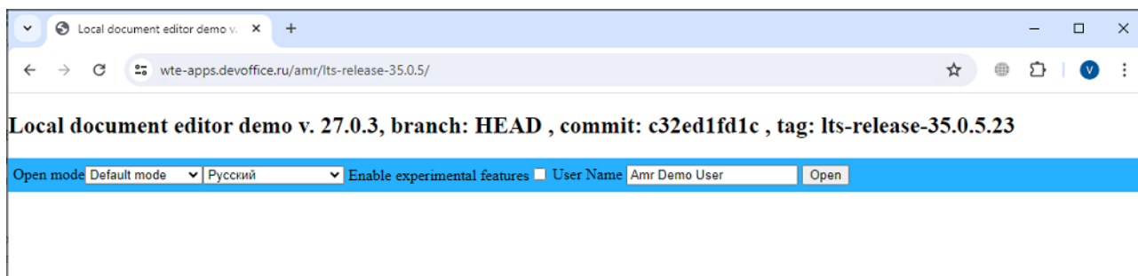
Рисунок 1 – Окно демонстрационного примера использования ПО МойОфис